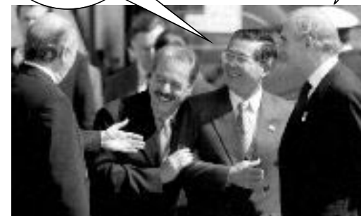
Lagos, Pastrana, Fujimori, De la Rúa en Brasilia, cuando se aprobó el IIRSA. Algunos de estos presidentes no terminaron demasiado bien sus mandatos